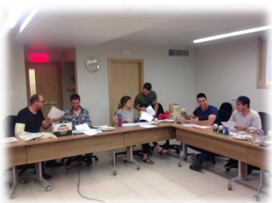
Soirée membership juin 2016 LANAUDIERE

Le 7 juin dernier, le conseil d'administration de la RAL s'est réuni à Joliette pour appeler ses membres expirés afin de renouveler leur membership. Les résultats de la soirée d'appel sont visibles sur le graphique ci-joint.