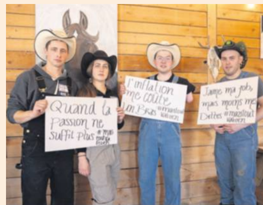
Des relèves participant au mouvement #maistoutvabien .

La FRAQ salue l'initiative de ses membres et poursuivra ses actions auprès des différents paliers de gouvernement afin de rappeler l'urgence d'agir pour soutenir pleinement les relèves agricoles.