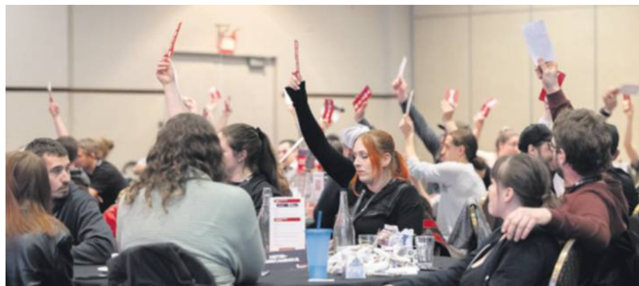
Sept résolutions ont été adoptées à majorité cette année. Elles s'ajouteront à la plateforme de revendications évolutive de la relève agricole.

Cette résolution fait référence aux crédits de cours pris en considération lors du calcul pour l'aide financière à la FADQ. Elle vise à demander que tous les crédits de tous les cours réussis et pertinents soient comptabilisés dans l'étude des niveaux pour toutes les subventions.