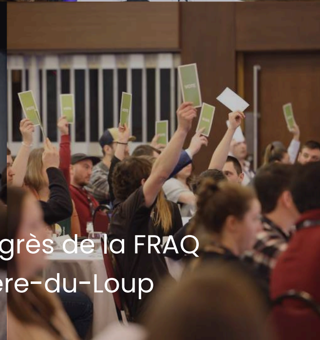
Congrès de la FRAQ Rivière-du-Loup