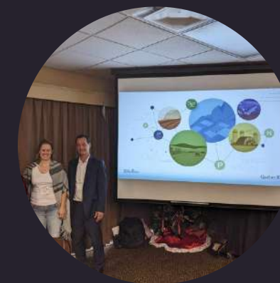
Cocréation règlement d'exploitation agricole