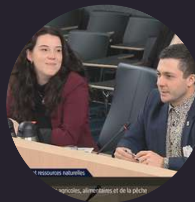
Participation au consultation projet de loi 28