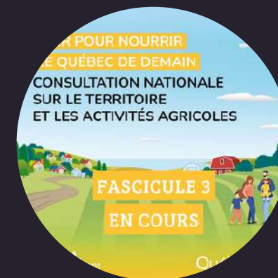
Participation aux consultations territoire