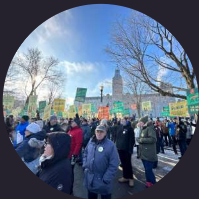
Marche pour la relève