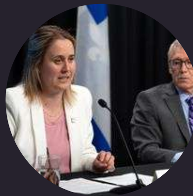
Annonce d'une aide d'urgence