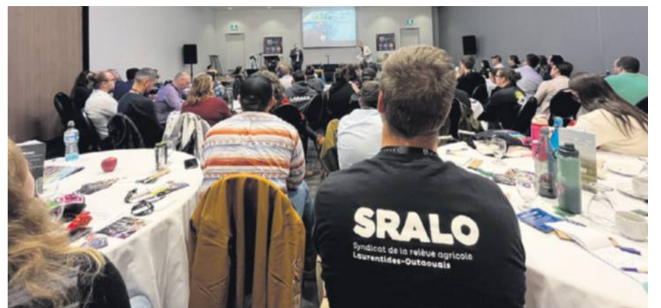
Des membres de la FRAQ des quatre coins du Québec ont pu prêter l'oreille à de nombreux acteurs du milieu, tant des partenaires que d'autres producteurs, et échanger avec eux.