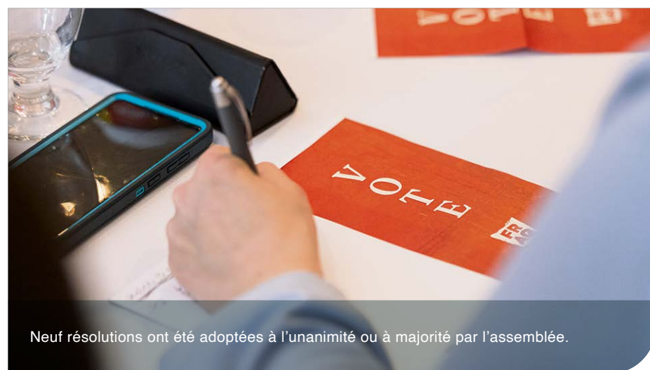
Neuf résolutions ont été adoptées à l'unanimité ou à majorité par l'assemblée.

Finalement, la FRAQ demande à ce qu'un changement mineur soit fait au programme Appui Capital Relève. En effet, le congé de capital débute actuellement à la délivrance du certificat de prêt alors que le premier déboursement peut parfois arriver beaucoup plus tard. Il serait beaucoup plus logique de démarrer ce congé lors du premier déboursement pour bénéficier de la période complète. ■