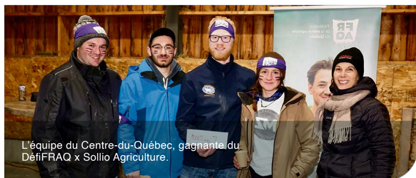
L'équipe du Centre-du-Québec, gagnante du DéfiFRAQ x Sollio Agriculture.

Félicitations à tous les participants à cette grande partie de plaisir! 🍷