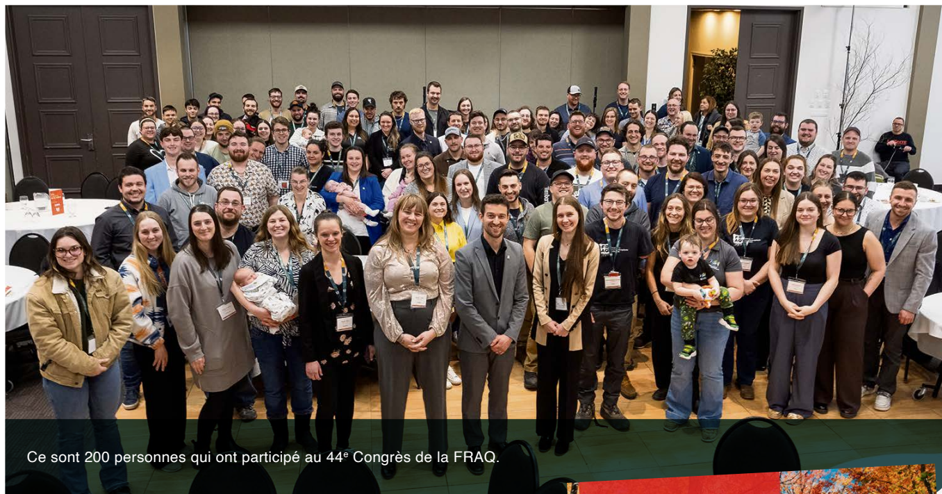
Ce sont 200 personnes qui ont participé au 44 e Congrès de la FRAQ.

Ce sont 200 personnes qui ont participé à ces trois journées d'échanges et de rencontres en Estrie, faisant de notre Congrès un beau moment de mobilisation de la relève agricole du Québec. ■