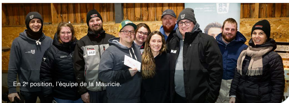
En 2 e position, l'équipe de la Mauricie.